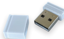
訓練機 USB 軟體升級套件 部件編號 8028-000011-XX