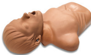
訓練機演示用人體模型 部件編號 8000-0835-01