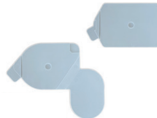
Trainer CPR Uni-padz 電擊片替換襯墊 部件編號 8028-000013