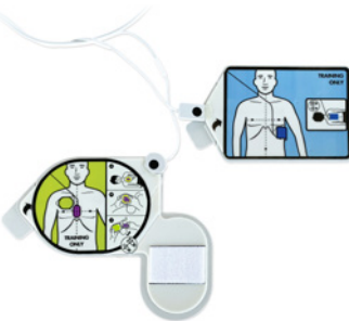
Trainer CPR Uni-padz® 電擊片替換黏貼凝膠 部件編號 8028-000014 (每盒 5 片)