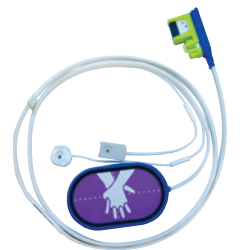
CPR Uni-padz 訓練貼片導線 部件編號 8028-000010