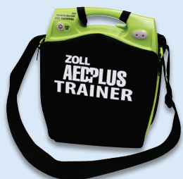
Custodia AED Plus Trainer Codice n. 8000-0375-01