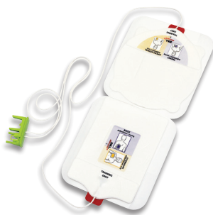
Elettrodi Stat-padz® II Trainer Codice n. 8900-0805-01 (Confezione da 6pz)