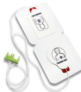
Elettrodi Pedi-padz® II Trainer Codice n. 8900-000861-01 (Confezione da 6pz)