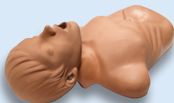
Manichino per dimostrazione AED Plus Trainer Codice n. 8000-0835-01