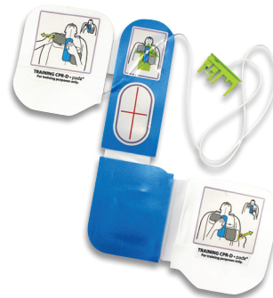
Elettrodi CPR-D-padz Trainer Codice n. 8900-0804-01