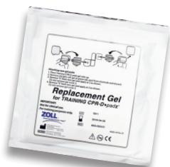
Gel adesivi di ricambio per elettrodi CPR-D-padz Trainer Codice n. 8900-0803-01

(I ricambi devono essere ordinati separatamente)