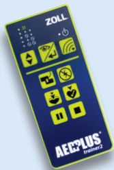
Telecomando AED Plus Trainer2 di ricambio Codice n. 8008-0007